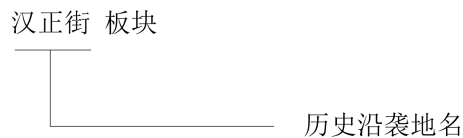
图 1 历史沿袭地名命名示例