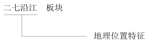
图 3 地理位置特征命名示例